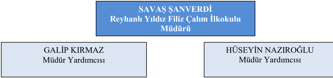
Tablo 3: Okul Çalışanları Mevcut Verileri